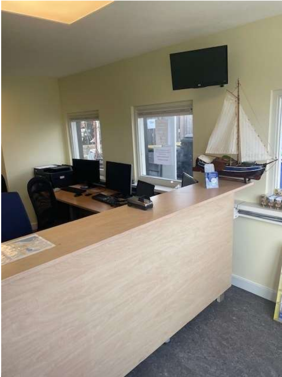
Een dag later is bijna alles gemonteerd, Foto; Bram Aertssen

De voorgenomen nieuwbouw van het huidige trekker kot hebben we na rijp beraad vooruitgeschoven naar eind dit jaar, of voorjaar 2026. Dit, omdat we dit voorjaar nog enkele andere af te werken klussen hebben en de "harde kern" van de TC na alle grote klussen van de afgelopen paar jaar even gas wil terugnemen. Op het programma staan eerst nog het sanitair gebouwtje afwerken: de boeiboorden en buitenverlichting aanbrengen, de TC-werkplaats herinrichten en het afwerken van de trap en steiger naast de helling.