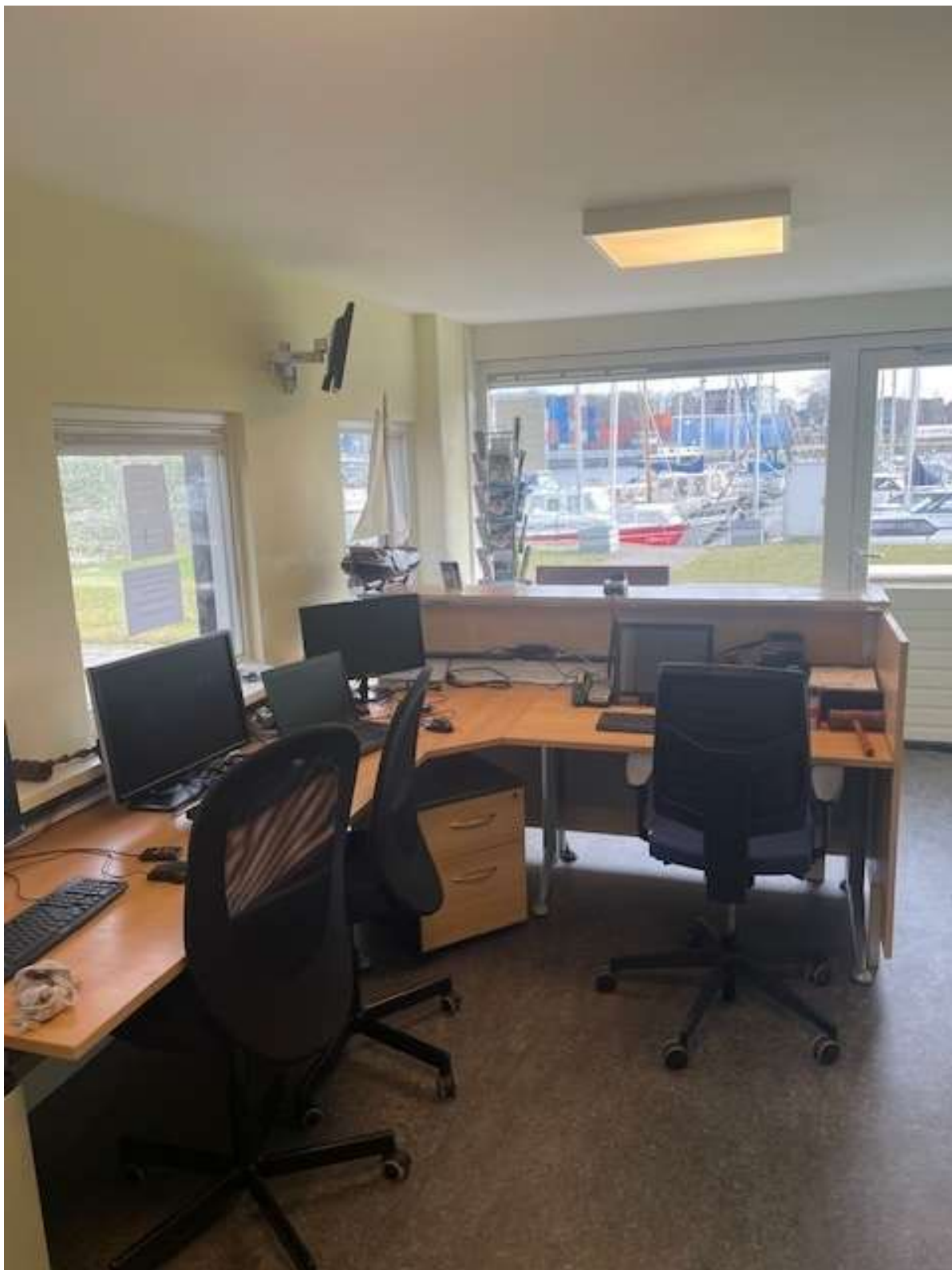
Kijkje in het vernieuwde havenkantoor

Voor de uitvoering van deze klussen zullen we leden inschakelen in het kader van de komende zelfwerkzaamheid.